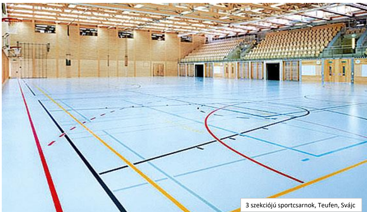
3 szekciójú sportcsarnok, Teufen, Svájc