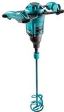
- keverőgép COLLOMIX XO 1