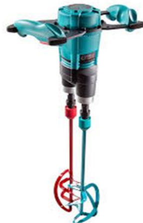
- duplaszáras keverőgép COLLOMIX XO 55