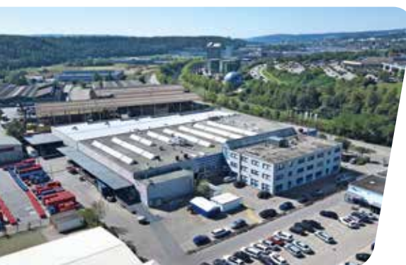
CONICA AG, Schaffhausen, Svájc