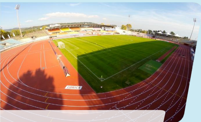
Olympique Stadion, Lausanne, Svájc