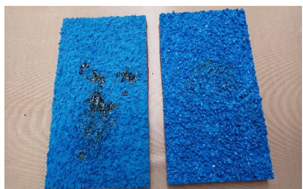
balra lakk nélkül jobbra lakkozott