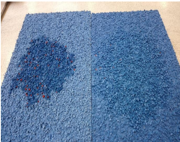
balra lakk nélkül jobbra lakkozott