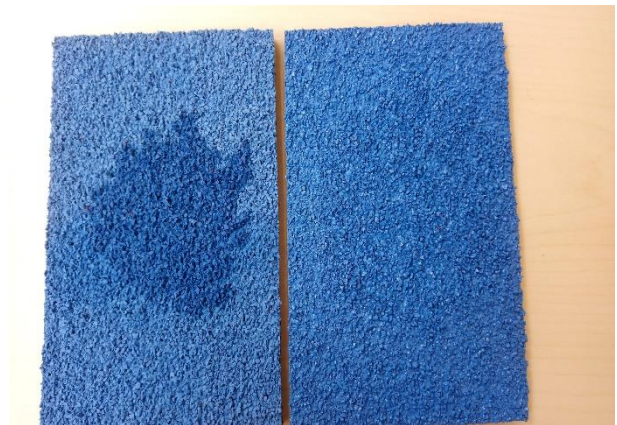
balra lakk nélkül jobbra lakkozott