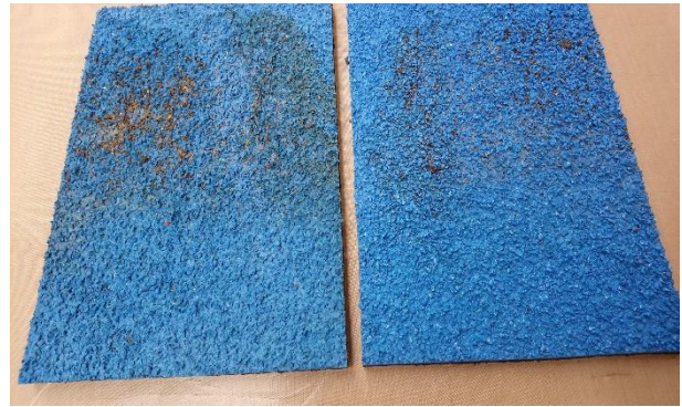
balra lakk nélkül jobbra lakkozott