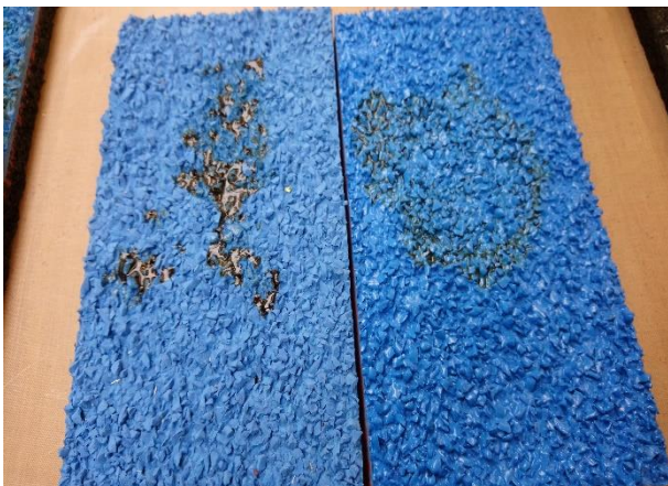
balra lakk nélkül jobbra lakkozott