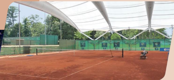
National Tennis Centre (NTC), London, Anglia

Profiként vagy klubszinten, kültéren vagy beltéren – a CONIPUR® PRO CLAY első osztályú játéktulajdonságokat kínál. A burkolati rendszer teljesen egyenletes játékfelületet garantál. Ennek eredményeként tökéletes elugrást és egyenletes csúszási tulajdonságokat mutat. Kíméletesen hat az ízületekre, és kisebb a sérülésveszély, mint a kemény pályákon, vagy a szőnyeges felületeken.