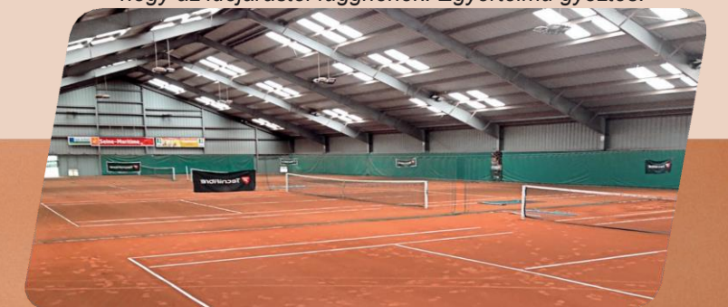
MONT-SAINT-AIGNAN TENNIS CLUB, MONT-SAINT-AIGNAN, FRANCE SYSTEM: CONIPUR® PRO CLAY indoor ÉPÍTÉS ÉVE: 2013

Beltéri környezetben a CONIPUR® PRO CLAY egyszerűen verhetetlen az MST-nek köszönhetően. A minimális karbantartás mellett alacsony porképződés tökéletes lehetőséget biztosít a profik és az amatőr sportolók számára, hogy felkészüljenek a salakpályás szezonra télen és tavasszal – anélkül, hogy az időjárástól függnének. Egyértelmű győztes.